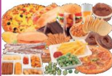
Fig. 2.17 La ingesta de comida poco nutritiva contribuye a generar desórdenes alimenticios.

En la sociedad actual, sin embargo, las grasas están demasiado "al alcance", y la tendencia innata a comerlas conduce a problemas como la obesidad, la diabetes e incluso el cáncer, concluyen en la revista Proceedings of the National Academy of Sciences . Tras el hallazgo, los científicos sugieren que sería posible revertir esta tendencia a abusar de las grasas usando fármacos que bloqueen los receptores de los cannabinoides.