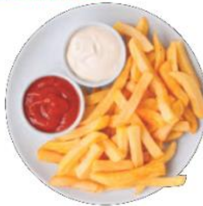
Fig. 2.16 Se cree que las grasas contienen sustancias que pueden crear adicción.

Una sustancia natural similar a la marihuana tiene la culpa, según un estudio de la Universidad de California Irvine (EE. UU.). Según Daniele Piomelli y sus colegas, las grasas de ciertos alimentos producen en nuestro digestivo endocannabinoides, sustancias químicas similares a la marihuana, relacionadas con la euforia, pero también con el hambre. Los azúcares y las proteínas, afirman los investigadores, no tienen este efecto. El proceso empieza en la lengua, donde las grasas de los alimentos generan una señal que viaja al cerebro, y luego continúa a través del nervio vago hasta los intestinos.